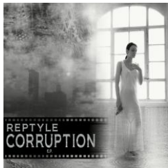
„Corruption e.p.” (2011)